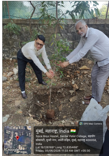
मुंबई, महाराष्ट्र, India 🇮🇳 Spce Boys Hostel, Sardar Patel College, सहयोग सोसायटी, मुन्शी नगर, अंधेरी पश्चिम, मुंबई, महाराष्ट्र 400058, India Lat 19.126189° Long 72.835488° Friday, 05/06/2026 11:33 AM GMT +05:30