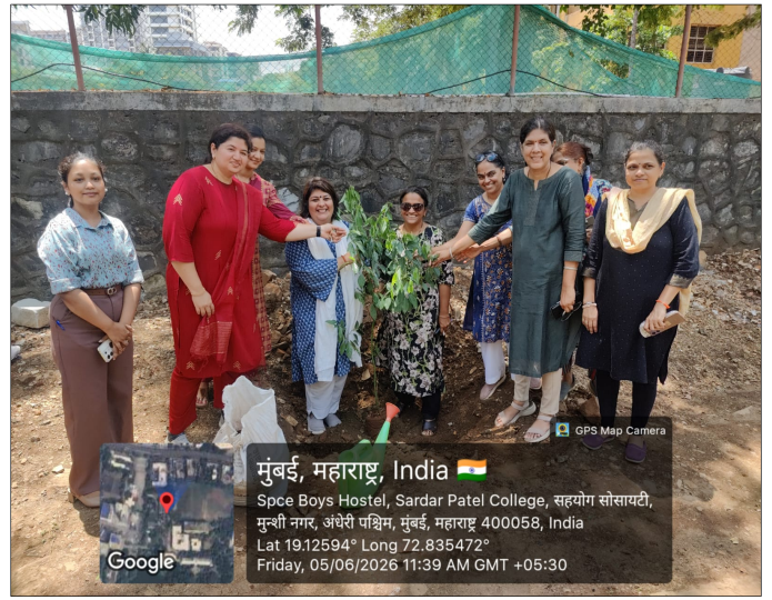
मुंबई, महाराष्ट्र, India 🇮🇳 Spce Boys Hostel, Sardar Patel College, सहयोग सोसायटी, मुन्शी नगर, अंधेरी पश्चिम, मुंबई, महाराष्ट्र 400058, India Lat 19.12594° Long 72.835472° Friday, 05/06/2026 11:39 AM GMT +05:30