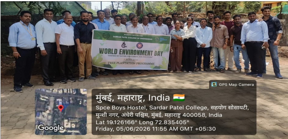
मुंबई, महाराष्ट्र, India 🇮🇳 Spce Boys Hostel, Sardar Patel College, सहयोग सोसायटी, मुन्शी नगर, अंधेरी पश्चिम, मुंबई, महाराष्ट्र 400058, India Lat 19.126166° Long 72.835405° Friday, 05/06/2026 11:55 AM GMT +05:30