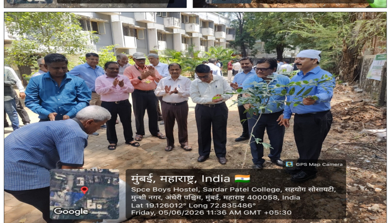
मुंबई, महाराष्ट्र, India 🇮🇳 Spce Boys Hostel, Sardar Patel College, सहयोग सोसायटी, मुन्शी नगर, अंधेरी पश्चिम, मुंबई, महाराष्ट्र 400058, India Lat 19.126012° Long 72.835486° Friday, 05/06/2026 11:36 AM GMT +05:30