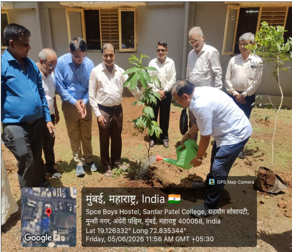
मुंबई, महाराष्ट्र, India 🇮🇳 Spce Boys Hostel, Sardar Patel College, सहयोग सोसायटी, मुन्शी नगर, अंधेरी पश्चिम, मुंबई, महाराष्ट्र 400058, India Lat 19.126332° Long 72.835344° Friday, 05/06/2026 11:56 AM GMT +05:30