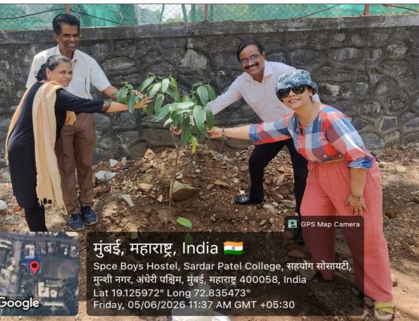
मुंबई, महाराष्ट्र, India 🇮🇳 Spce Boys Hostel, Sardar Patel College, सहयोग सोसायटी, मुन्शी नगर, अंधेरी पश्चिम, मुंबई, महाराष्ट्र 400058, India Lat 19.125972° Long 72.835473° Friday, 05/06/2026 11:37 AM GMT +05:30