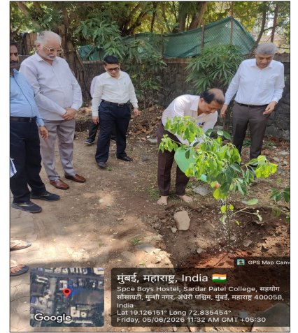
मुंबई, महाराष्ट्र, India 🇮🇳 Spce Boys Hostel, Sardar Patel College, सहयोग सोसायटी, मुन्शी नगर, अंधेरी पश्चिम, मुंबई, महाराष्ट्र 400058, India Lat 19.126151° Long 72.835454° Friday, 05/06/2026 11:32 AM GMT +05:30