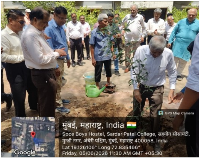
मुंबई, महाराष्ट्र, India 🇮🇳 Spce Boys Hostel, Sardar Patel College, सहयोग सोसायटी, मुन्शी नगर, अंधेरी पश्चिम, मुंबई, महाराष्ट्र 400058, India Lat 19.126106° Long 72.835466° Friday, 05/06/2026 11:30 AM GMT +05:30