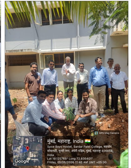
मुंबई, महाराष्ट्र, India 🇮🇳 Spce Boys Hostel, Sardar Patel College, सहयोग सोसायटी, मुन्शी नगर, अंधेरी पश्चिम, मुंबई, महाराष्ट्र 400058, India Lat 19.126788° Long 72.835401° Friday, 05/06/2026 11:48 AM GMT +05:30